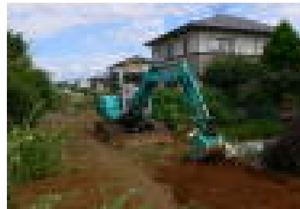
水土里の散歩道に ウッドチップを敷き詰める [維持管理活動：9月]