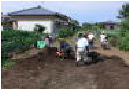
水土里の散歩道を造るため 土改職員と協働での整地作業 [維持管理活動：9月]